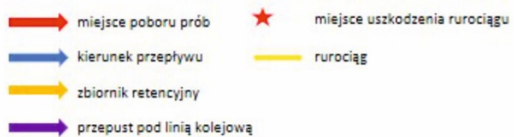
Ryc. 1. Szkic sytuacyjny dzielnicy Łęgnowo